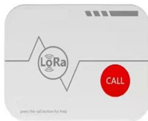
2. ปุ่มกดเรียก

** 2 ชุดนี้สามารถติดตั้งบนผนังหรืออุปกรณ์อื่นๆ ตามลูกค้าได้ ช่วยลดขั้นตอนการเดินสายในการติดตั้ง **