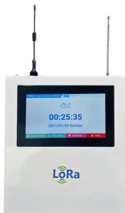
1. แผงควบคุม